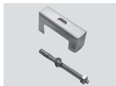
Szyna korygująca mocowanie