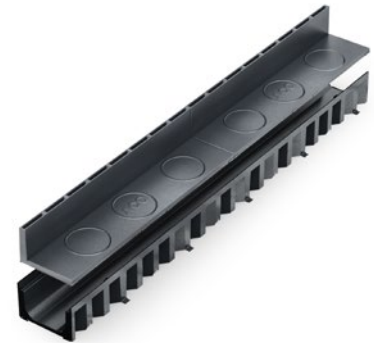
ACO Hexaline kanał 1m

Stosować wyłącznie do odwadniania terenów wokół domów jednorodzinnych.