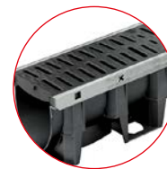
Korytka z krawędzią ze stali ocynkowanej