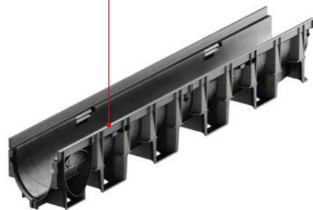
Korytka ACO XtraDrain® X 100 C (z krawędzią z tworzywa)

Rusztzy z zamknięciem zatraskowym Drainlock® do kanałów i skrzynek X 100 C i X 100 S: ➔ patrz str. 25