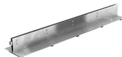
Rama szczelinowa SR 100 S ze stali ocynkowanej, długość 1 m