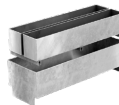
Rama szczelinowa SR 100 S ze stali ocynkowanej do skrzynki odpływowej, długość 0,5 m

Inne wymiary i kształty ramy szczelinowej - na zapytanie.