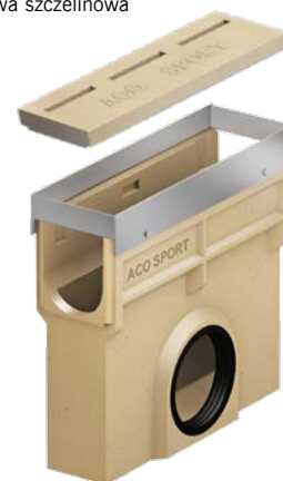
Skrzynka odpływowa do kanałów szczelinowych