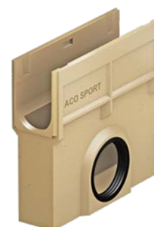
Skrzynka odpływowa do kanałów otwartych