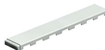
Pokrywa z tworzywa GFUP