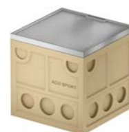
Studzienka rozdzielcza dla instalacji elektrycznej