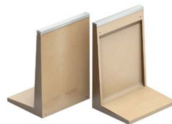
Rów z wodą - elementy