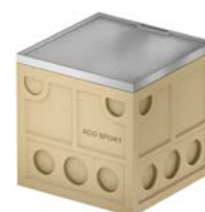
Studzienka rozdzielcza dla instalacji elektrycznej